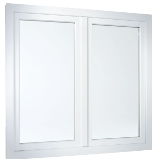
2-flügeliges Fenster in flächerversetzter Variante